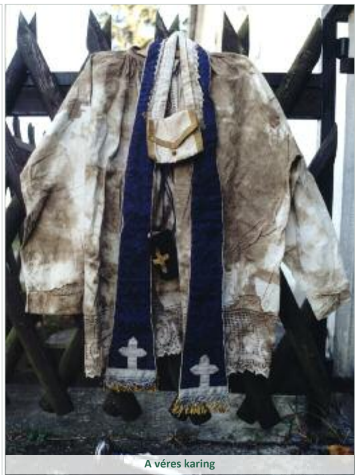
A véres karing