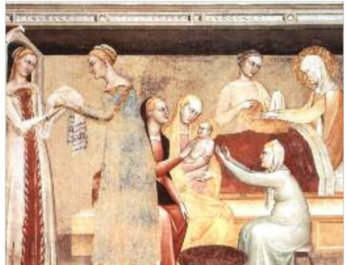
Giovanni Da Milano: A Szűz születése (1365). A kép a firenzei Santa Croce (Szent Kereszt) templom Rinuccini kápolnájában található

Bízzátok hát egész életeteket, örömeiteket és bánatokat a boldogságos Szűzanyára, kérjétek, világossítson életetek sokszor sötét útján, tanítson meg