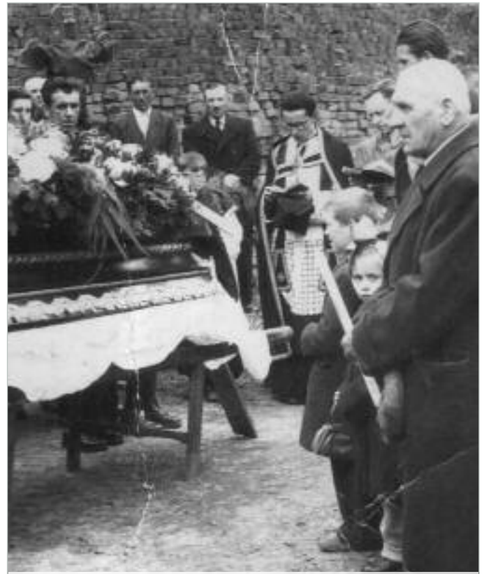
Brenner János temetési szertartás közben

Brenner János feltétlen Isten- és emberszeretetről tanúskodik az ő vértanúhalála. Ezt érezték át, ezt értették meg akkori hívei, és ezért válhatott belőle mára nemcsak Kethely, nemcsak a Szombathelyi Egyházmegye, de egész Magyarország hitvalló papja. Azok, akik az ő életszentségéről és vértanúságáról tanúskodtak a szentté avatási eljárásban, úgy beszéltek róla, mintha ma is élne, mintha a Püspöki Palotából az ő szentmiséjére igyekeznének, és csak átjöttek volna, hogy elbűszkélkedjenek vele, milyen jó papjuk van. És szépen lassan mi, akik lebonyolítottuk