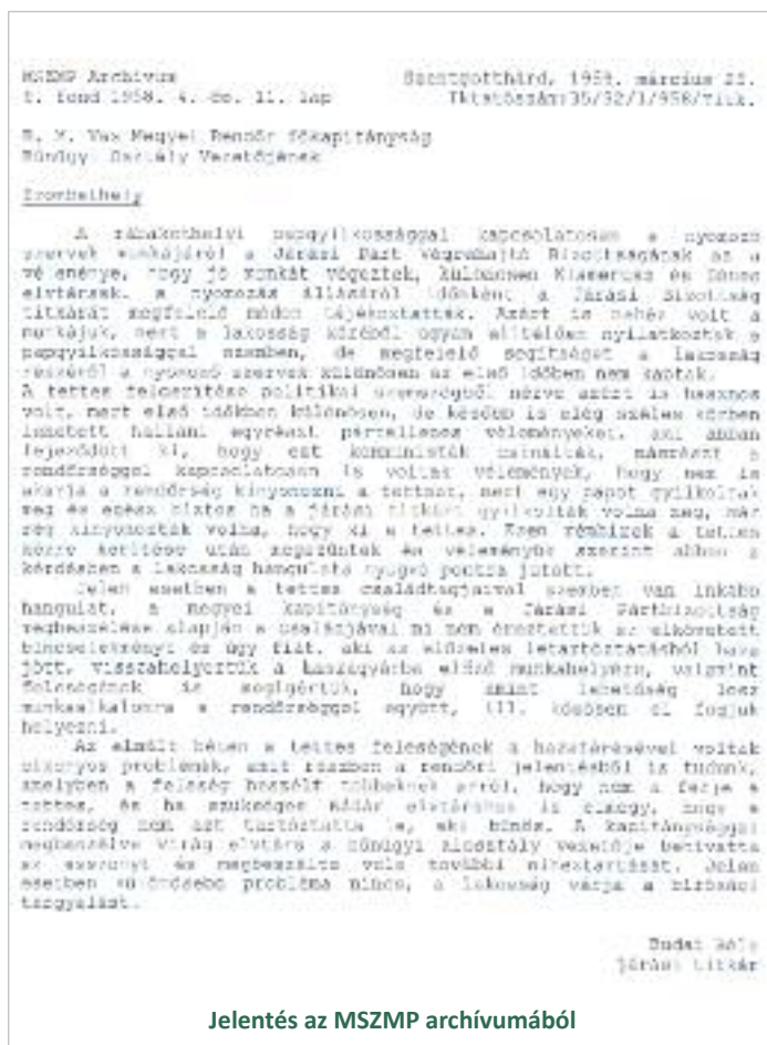
Jelentés az MSZMP archívumából