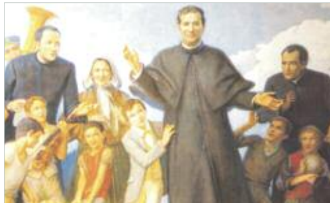
Bosco Szent János 1815. augusztus 16. – 1888. január 31.

keltek, az én lelkemben legalább az őszinte bánat lelkülete legyen meg.