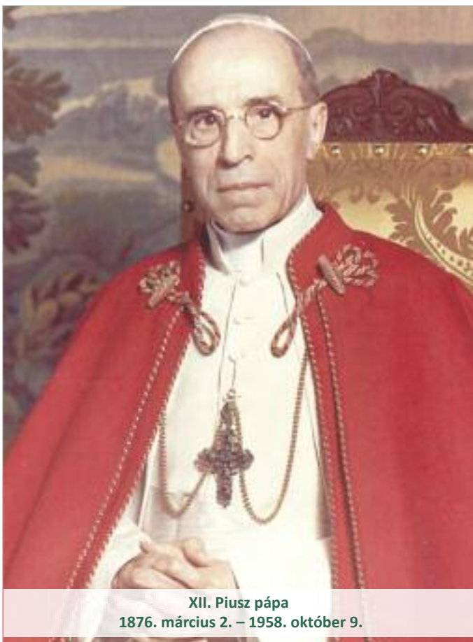
XII. Piusz pápa 1876. március 2. – 1958. október 9.

S oly nagy a szeretet lángja és az égést úgy kívánja, hogy kihúnyni sose fog: semmi zápor el nem oltja s a folyóvíz el nem fojtja; mindig csak jobban lobog! S ez a láng maga az élet: másra nem lehet szükséged! Ami jó még van egyéb, nélküle mind nem ér semmit! Mind elolvad és elomlik! Mind csak tűnő semmiség. Ámen.