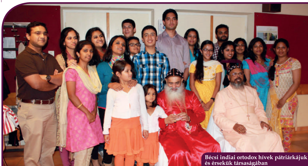
Bécsi indiai ortodox hívek pátriárkájuk és érsekük társágában