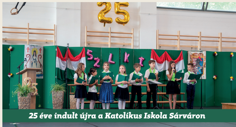
25 éve indult újra a Katolikus Iskola Sárváron