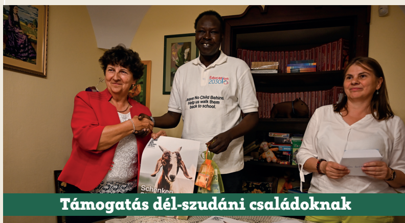
Támogatás dél-szudáni családoknak

15 kecske megvásárlásával támogatja a dél-szudáni embereket a Szombathelyi Egyházmegye és a Szombathelyi Egyházmegyei Karitás. A polgárháború sújtotta országban hatalmas segítséget jelent ez a támogatás. Június 8-án adták át az állatok árát a dél-szudáni karitás vezetőjének.