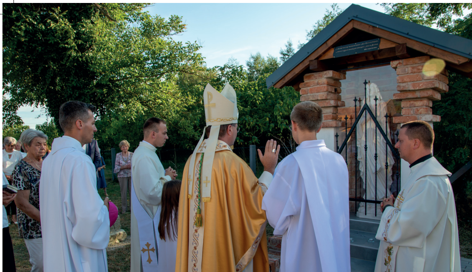
Templomkert- és szobormegáldás Karakóban

Sikeres pályázatoknak köszönhetően az elmúlt 2 évben felújították Karakóban a temető kerítését, a sírok között térkövezett utakat építettek, felújították a templomkertben álló Mária-szobrot és új fákat ültettek, parkosították a területet. A hívek adományából márványból faragott Mária-szobrot állítottak