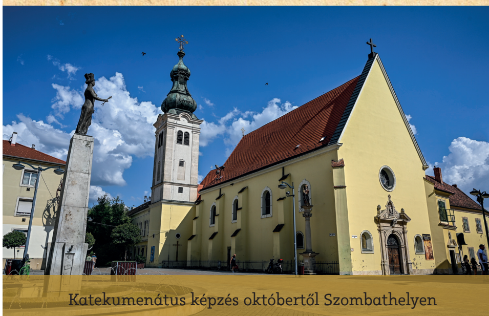
Katekumenátus képzés októbertől Szombathelyen