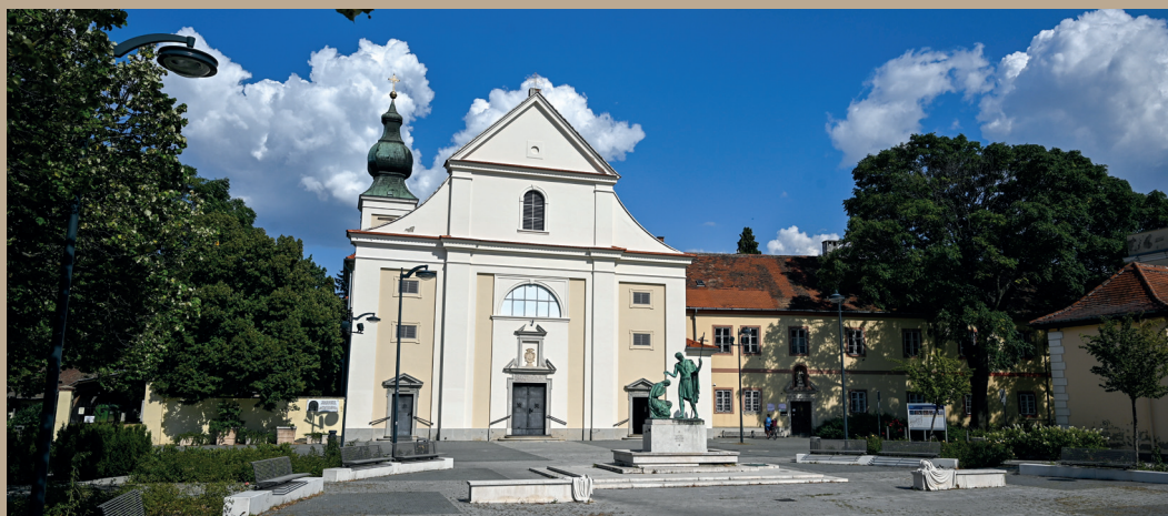
A Szent Márton-templom és a domonkos rendház Szombathelyen